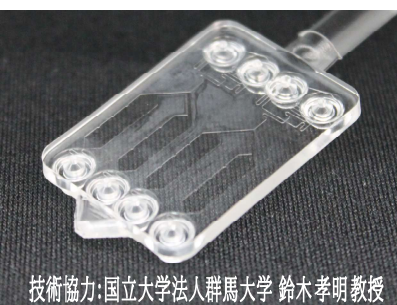
技術協力: 国立大学法人群馬大学 鈴木孝明教授